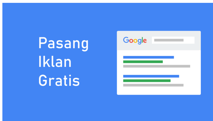
Gambar 1.2 Contoh Iklan gratis google

Media internet yang begitu luas dan tanpa batas menawarkan berbagai kemudahan bagi kalian dalam menemukan sarana beriklan gratis. Sudah banyak situs-situs yang menawarkan iklan gratis tentunya dengan timbal balik yang jelas dan pantas. Biasanya anggota situs tersebut diminta untuk mendaftarkan produknya dan menulis penawaran produk atau jasa tanpa harus mengeluarkan biaya sedikitpun.