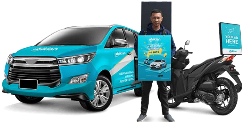
Gambar 1.3 Layanan UBiklan

Dengan berkembangnya teknologi transportasi di Indonesia seperti ojek online yang kian menjamur, pilihan promosi menggunakan ojek online ini juga dapat dijadikan pilihan dalam memasarkan produk kalian. Bagaimana caranya? kalian dapat menggunakan Ojek Online Advertising (beriklan melalui driver ojek), tentunya kalian sering melihat stiker pada mobil driver ojek online ataupun pengendara ojek motor yang menggunakan papan iklan dibelakang kendaraannya. Kenapa media ini dianggap efektif? media ini dianggap efektif khususnya dikota-kota besar dengan tingkat kemacetan yang tinggi, dengan kemacetan yang terjadi maka iklan kalian akan sangat mungkin tersampaikan oleh calon pelanggan. Salah satu layanan advertising jenis ini yang bisa kalian gunakan adalah " Ubiklan ", startup Car Advertising yang meluncurkan layanannya sejak tahun 2016. Ubiklan sendiri memiliki berbagai pilihan pemasangan iklan mobil, mulai dari bodi mobil bagian belakang ( partial ), pintu kanan-kiri ( side ), kap mobil depan ( front ), dan kaca mobil belakang ( back ).