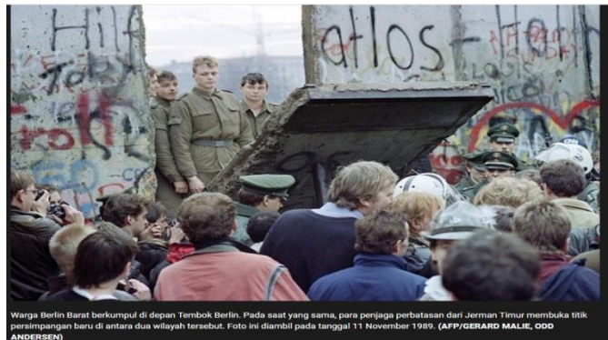
Warga Berlin Barat berkumpul di depan Tembok Berlin. Pada saat yang sama, para penjaga perbatasan dari Jerman Timur membuka titik persimpangan baru di antara dua wilayah tersebut. Foto ini diambil pada tanggal 11 November 1989.

Berlin - yang terletak di bagian Timur Jerman - sendiri terbagi empat. Wilayah Inggris, Prancis, dan AS di barat dan zona Soviet di timur. Maka Berlin Barat menjadi kantong negara Barat yang dikelilingi oleh wilayah Jerman Timur.