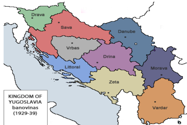
Wilayah Yugoslavia ketika masih menjadi kerajaan.

Yugoslavia terdiri dari enam negara federasi (bagian) dan dua provinsi otonom, yaitu: