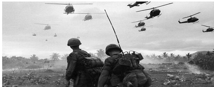
Perang Vietnam yang memakan banyak korban jiwa akhirnya selesai.

Presiden Vietnam sempat berganti 2 kali, pertama yaitu bergantinya Nguyen Van Thieu ke Tran Van Huong. Nguyen Van Thieu adalah presiden yang menandatangani Persetujuan Paris karena Amerika Serikat berjanji mengirim pesawat B-52 yang akan mengebom Vietnam Utara jika melakukan pelanggaran. Namun hal itu tidak dilakukan oleh Amerika Serikat, dan Vietnam Selatan kekurangan kekuatan militernya. Saat bantuan dari Amerika Serikat tidak datang, Vietnam Utara semakin di atas angin. Kemudian pada tanggal; 28 April 1975, Tran Van Huong digantikan oleh Duong Van Minh sebagai Presiden Vietnam Selatan. Namun, baru sehari memimpin, wilayahnya langsung diserang oleh pasukan gerilya Vietnam Utara yaitu Vietcong. Wilayah yang menjadi tujuan serangan Vietcong adalah Saigon.