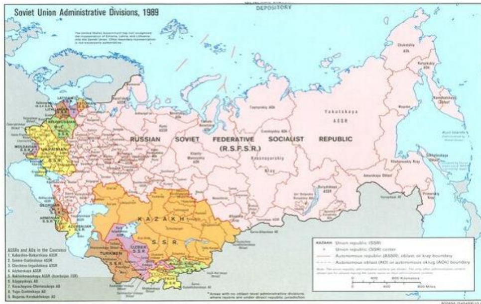
Peta wilayah USSR tahun 1989.

Pada masa kejayaannya, Uni Soviet yang merupakan gabungan dari beberapa negara berhasil menularkan paham komunismenya pada beberapa negara di luar Eropa Timur. Namun dinamisme perkembangan di dalam tubuh negaranya sendiri gagal menyatukan negara-negara bagian yang bersatu di bawah naungan Uni Soviet.