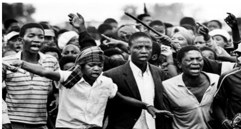
Perjuangan Rakyat Afrika menentang Apartheid di Afrika Selatan

Orang-orang kulit hitam yang semula tidak mengerti bahwa kebijakan pemerintahannya, lambat laun mengerti bahwa tujuan sebenarnya adalah diskriminasi rasial (perbedaan warna kulit). Orang kulit hitam tidak tinggal. Oleh karena itu mereka bangkit mengadakan perlawanan, mereka memberikan perlawanan dengan membentuk organisasi modern yakni African National Congress (ANC) . ANC adalah partai politik yang dibentuk untuk mengalahkan dominasi politik kulit putih pada tahun 1952 di bawah pimpinan Nelson Mandela.