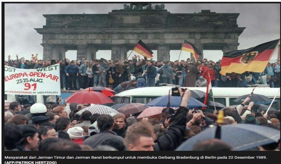
Masyarakat dari Jerman Timur dan Jerman Barat berkumpul untuk membuka Gerbang Bradenburg di Berlin pada 22 Desember 1989.

Kegagalan Tembok Berlin setelah menjulang selama 28 tahun akhirnya runtuh. tembok yang menjadi simbol pemisah tersebut dirobohkan oleh massa. Aksi massa ini didorong oleh runtuhnya Uni Soviet serta penerapan sejumlah reformasi liberal yang dilakukan oleh Jerman Timur sebelumnya. Pada tanggal 9 November 1989 pagi, massa dari Jerman Barat dan Jerman Timur berkumpul di Tembok Berlin. Aksi ini didasari oleh pengumuman Pemerintah Jerman Timur. Pada pagi 9 November, pemerintah Jerman Timur, mengatakan jika warganya bisa dengan bebas melintasi tembok pembatas ke wilayah Barat. Setelah itu, warga Jerman Timur mengerumuni Tembok Berlin, di mana mereka disambut oleh warga di Berlin Barat. Melansir laman History, orang-orang dari Berlin Barat dan Timur mulai berkumpul di sekitar tembok. Mereka menyerukan kalimat Tor auf atau "Buka Gerbangnya" sembari minum bir serta champagne. Kemudian, pada tengah malam, massa mulai memenuhi checkpoint tembok. Saat itu, dilaporkan sebanyak 2 juta orang datang berkumpul di Tembok Berlin. Mereka memanjat dan membongkarnya. Kala itu, massa meruntuhkan tembok menggunakan palu dan berusaha menyingkirkan potongan-potongan tembok menjauh dari lokasi aslinya. Orang-orang Berlin sendiri menyebut mereka yang meruntuhkan tembok sebagai Mauerspechte atau para pelatuk tembok. Beberapa jurnalis menggambarkan peristiwa tersebut sebagai pesta