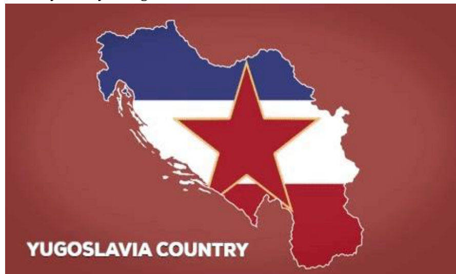
Wilayah negara-negara bagian Yugoslavia. (Sumber: Youtube chanel Feature History).

Banyaknya etnis yang menghuni Yugoslavia membuat Yugoslavia menjadi negara yang unik dan beragam. Namun disisi lain, beragamnya etnis di Yugoslavia menjadi penyebab utama berakhirnya riwayat negara tersebut.