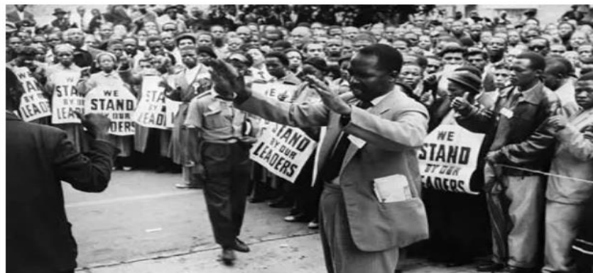
▲ ANC supporters pray outside the courthouse in Johannesburg in 1956 where anti-apartheid militants, including Nelson Mandela, are on trial.

Pada saat itu disita pula sejumlah dokumen rahasia, menyangkut ANC dan Tombak Bangsa. Mereka yang ditangkap yaitu Walter Sisulu, Govan Mbeki, Raymond Mhlaba, Ahmed Akthrada, Dennis Golberg dan Lionel Bernstein. Mandela bersama-sama dengan keenam rekannya diperiksa dengan tuduhan melakukan sabotase bersengkongkol untuk menumbangkan pemerintah dan membantu unsur asing menyerang Afrika Selatan. Mereka akhirnya divonis dengan hukuman seumur hidup pada tanggal 12 Juni 1964 dan harus mendekam dalam penjara di Pulau Roben Cape Town. Pada tahun 1982 Mandela dipindahkan lagi ke penjara Pollsmor juga masih daerah Cape Town. Selama di penjara itulah kampanye pembebasannya dilancarkan, baik di Afrika Selatan sendiri maupun di luar Afrika Selatan. Aksi protes dan kampanye pembebasan Mandela semakin berkobar sejak tahun 1982, bahkan pada tahun 1988 ulang tahun ke-70 Nelson Mandela dirayakan oleh bangsa kulit hitam Afrika Selatan dengan menggelar konser musik selama 120 jam non stop dan disiarkan ke-50 negara. Akibat kampanye pembebasan tokoh ANC ini, makin banyak negara yang menekan pemerintah Apartheid Afrika Selatan baik secara politik maupun ekonomi. Kampanye pembebasan itu membuat Mandela menjadi tokoh tahanan politik paling populer di dunia.