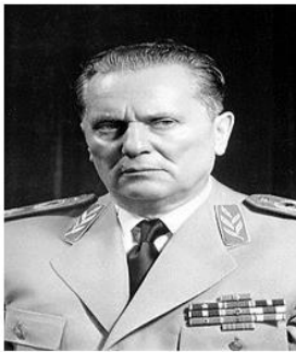
Josip Broz Tito.

Apa kabar siswa siswi hebat calon pemimpin bangsa ? Salam Historia. Masih semangat belajar sejarah dunia?