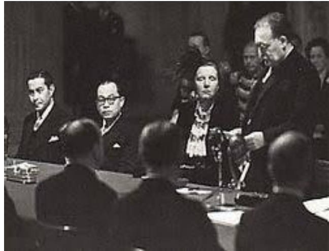
Bung Hatta (kedua dari kiri) di Istana Dam, Amsterdam, dan Ratu Juliana (kedua dari kanan) pada saat penyerahan kedaulatan

Belanda merupakan negara yang menolak kemerdekaan Indonesia dan ingin merebut kembali Indonesia. Peristiwa perebutan kembali ini terjadi pada Agresi Militer Belanda I (1947) dan Agresi Militer Belanda II (1948). Berkali-kali Indonesia melakukan kedaulatan Indonesia pada konferensi meja bundar. Hasil konferensi meja bundar yaitu membagi wilayah Indonesia dalam bentuk Federasi, RIS (Republik Indonesia Serikat). perundingan dengan Belanda, mulai dari perundingan Linggarjati, perjanjian Renville, perjanjian Roem-royen dan konferensi meja bundar (KMB). Belanda baru mengakui.