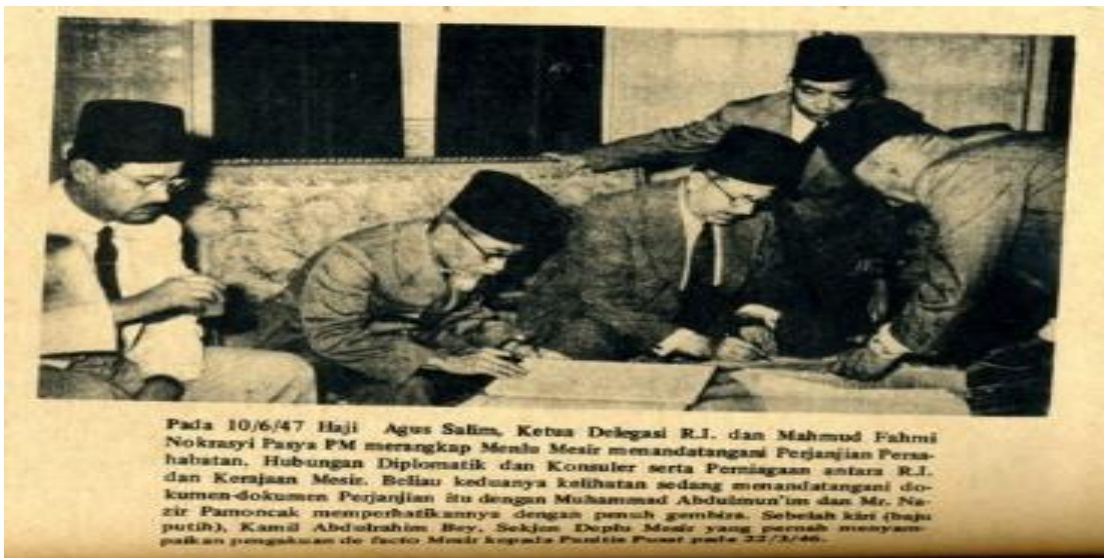
Gambar : Penandatanganan Perjanjian Persahabatan antara Indonesia dan Mesir Tahun 1947

Ada juga yang memiliki pendapat bahwa negara yang pertama mengakui kemerdekaan Indonesia baik secara de facto maupun de jure adalah Vatican , negerinya Paus. Kalau untuk kawasan Eropa mungkin saja betul negara ini yang pertama tetapi kalau untuk yang pertama di dunia, cukup sudah pernyataan dari pelaku sejarah di atas yakni A.H. Nasution untuk membantahnya.