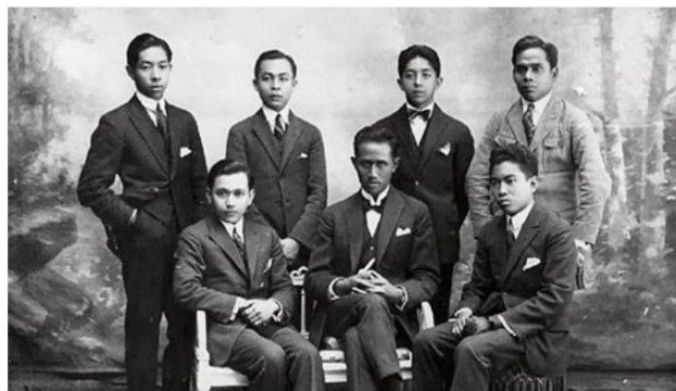
Gambar : Tokoh-tokoh Perhimpunan Indonesia

Tahun 1925 Indische Vereeniging berubah menjadi Perhimpunan Indonesia dengan tujuannya Indonesia merdeka. Banyak kegiatan yang dilakukan oleh aktivis PI Belanda maupun di luar negeri, diantaranya ikut serta dalam kongres Liga Demokrasi Perdamaian Internasional tahun 1926 di Paris, dalam kongres itu Mohammad Hatta dengan tegas menyatakan tuntutan akan kemerdekaan Indonesia. Pendapat-pendapat para aktifis PI juga banyak mereka sampaikan ke tanah air. Aksi-aksi yang dilakukan menyebabkan Hatta dkk dituduh melakukan pemberontakan terhadap Belanda. Karena dituduh menghasut untuk melakukan pemberontakan terhadap Belanda, maka tahun 1927 tokoh-tokoh PI diantaranya Mohammad Hatta, Nasir Pamuncak, Abdul Majid Djojonegoro dan Ali Sastroamijoyo ditangkap dan diadili. Tindakan-tindakan PI inilah sehingga organisasi ini digolongkan sebagai organisasi yang menempuh strategi perjuangan radikal.