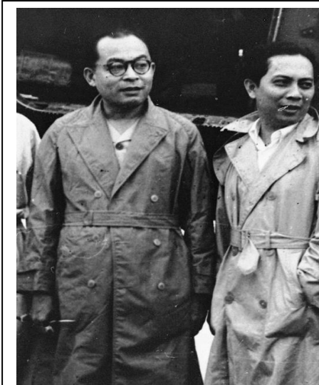
Gambar : Mohammad Hatta dan Sjahrir, dua tokoh yang berperan besar dalam PNI-Baru