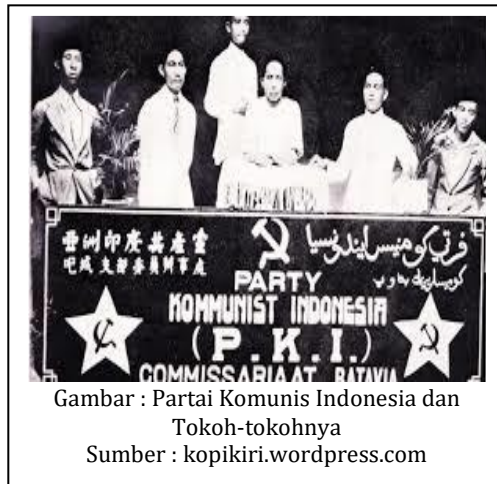
Gambar : Partai Komunis Indonesia dan Tokoh-tokohnya

Partai politik ini berakar dari sebuah organisasi politik bentukan seorang Belanda bernama Henk Sneevliet yaitu Indische Sociaal-Democratische Vereeniging (ISDV) pada tahun 1914. Melalui organisasi ini, Sneevliet mengembangkan paham Komunis, terutama di kalangan buruh. Beberapa pengurus Sarekat Islam cabang Semarang kemudian terpengaruh dengan paham partai ini, yakni Semaun dan Darsono.