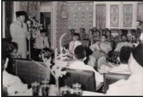
Partindo sebagai Pecahan PNI

Kongres dan forum yang membawa nama Soekarno selalu dibanjiri rakyat. Karenanya, paham Soekarnoisme dengan Marhaennya cepat sekali membesar. Begitu pula dengan Partindo yang menjadi kendaraan politiknya. Selanjutnya, segala sepak terjang Soekarno kembali disoroti Belanda karena menyebarluaskan keberanian untuk merdeka dan melawan pemerintahan kolonial Belanda.