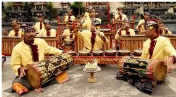
Gambar. 7 https://images.app.goo.gl/uKC3wwPCdQ2KiEwk9