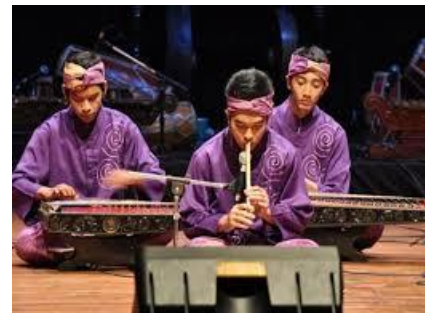
Gambar. 8