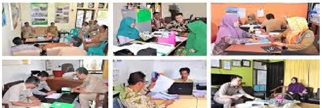
Gambar 1: manfaat evaluasi pemberdayaan komunitas di masyarakat

Sebelum membahas materi coba kalian perhatikan dan kritisi gambar berikut ini!