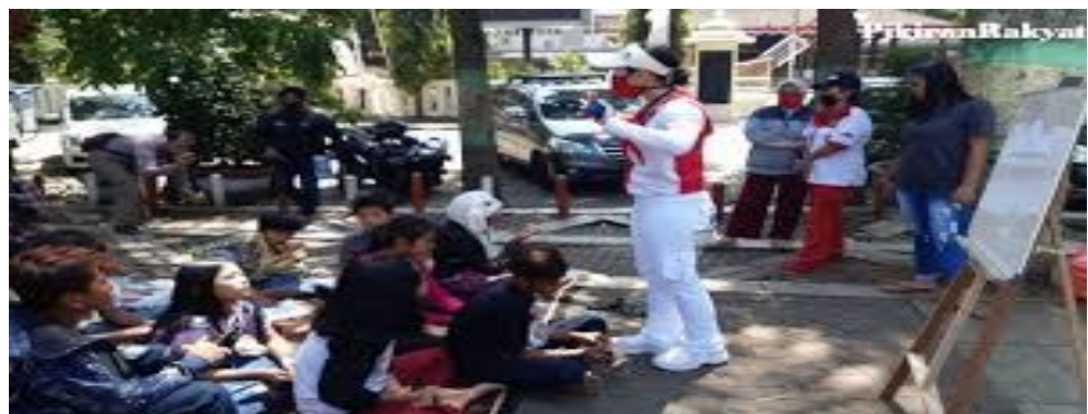
(monev kelompok anak jalanan untuk mengetahui masalah yg ada)

Dalam melaksanakan monev/pengamatan secara langsung terhadap suatu pemberdayaan yang termampu di lingkungan, baik yang sedang berlangsung saat itu atau masih berjalan yang meliputi berbagai aktifitas perhatian terhadap suatu kajian pemberdayaan komunitas dengan menggunakan penginderaan.