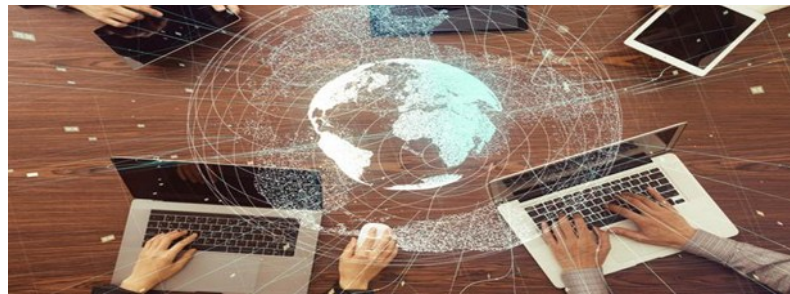
Gambar 1: Analogi Globalisasi

Gambar di atas mencerminkan ciri-ciri globalisasi yang tanpa disadari merubah kehidupan manusia. Istilah globalisasi berasal dari kata globus yang berarti bola yang bulat. Dari kata globus terbentuk istilah globe, yaitu model tiruan dunia atau bumi yang memberikan gambaran bentuk yang mendekati sebenarnya, yaitu bulat.