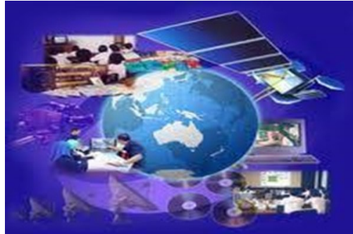
Gambar 3: Gambaran teknologi informasi

Perhatikan gambar Teknologi Informasi dan Komunikasi Menghubungkan Manusia dari Seluru belahan dunia di bawah ini!