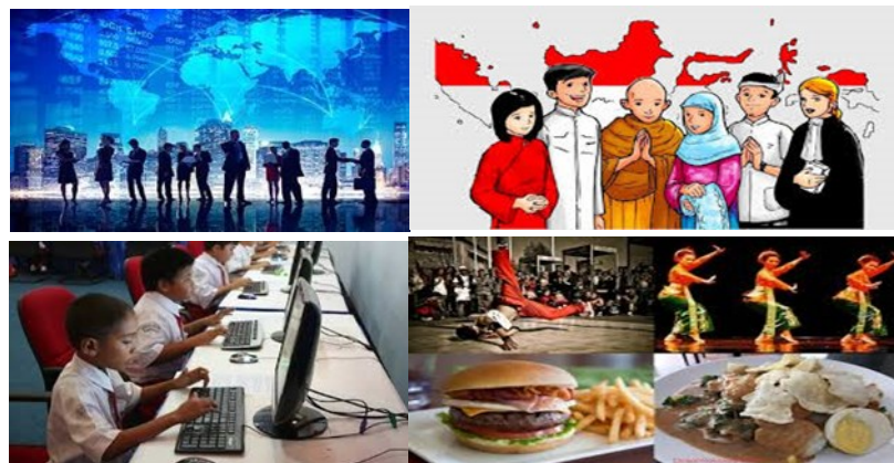
Gambar 3: Keragaman Sosial

Dari penjelasan tentang globalisasi di depan tersirat bahwa globalisasi dapat mengubah banyak bidang kehidupan masyarakat karena ruang lingkup globalisasi meliputi hampir seluruh bidang kehidupan masyarakat. Berdasarkan ruang lingkungannya, setidaknya kita mengenal lima macam globalisasi, yaitu, pertama, globalisasi ekonomi, kedua, globalisasi politik, ketiga, globalisasi ilmu pengetahuan dan teknologi, keempat, globalisasi sosial dan budaya, dan kelima, globalisasi agama. Coba kalian cermati dan analisis gambar berikut: