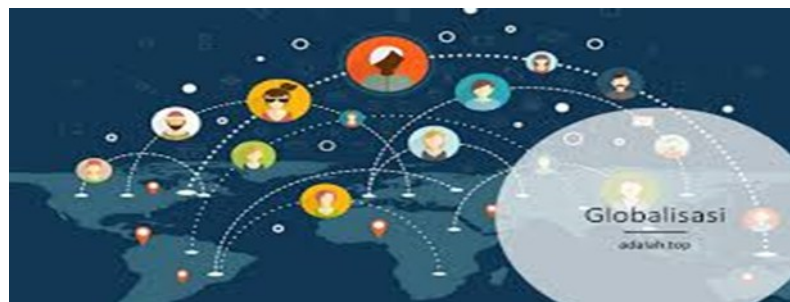
Gambar 2: Globalisasi

Dari kata globe itulah kemudian muncul istilah globalize atau globalisasi yang artinya mendunia. Sebagai istilah, globalisasi digunakan untuk menggambarkan semakin intensifnya hubungan sosial di antara individu, kelompok, atau masyarakat yang secara geografik masing-masing berada pada tempat-tempat yang saling berjauhan.