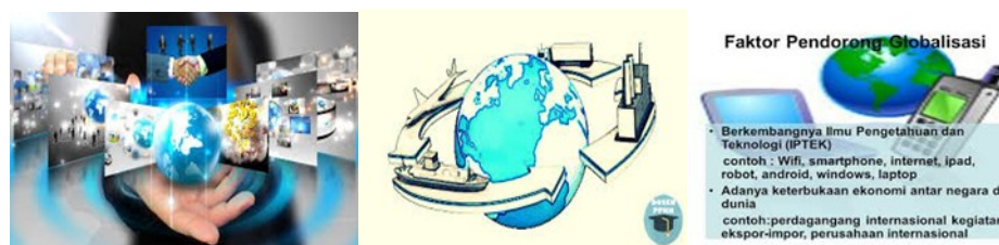
Gambar 5: Analogi Globalisasi

Coba kalian cermati dan analisis, gambar faktor-faktor penyebab globalisasi tersebut diatas! Mengapa terjadi globalisasi? Paling tidak terdapat tiga faktor yang menyebabkan terjadinya globalisasi, yaitu: