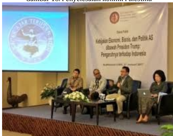
Gambar 18. Penyelesaian konflik Palestina

https://m.medcom.id . 16 September 2020, 18.00 WITA