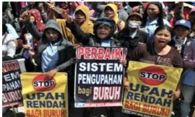
Gambar 1. Sekelompok orang melakukan demonstrasi kenaikan gaji

https://www.republika.co.id,14 September 2020, 09.00 WITA