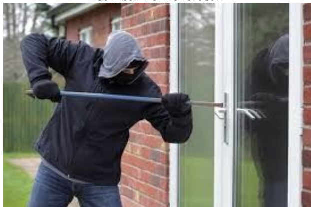
Gambar 16. Kekerasan

https://fin.co.id . 16 September 2020, 12.00 WITA