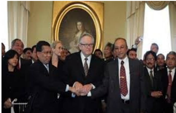
Gambar 11. RI dan GAM berdamai

https://www.liputan6.com . 16 September 2020, 14.00 WITA