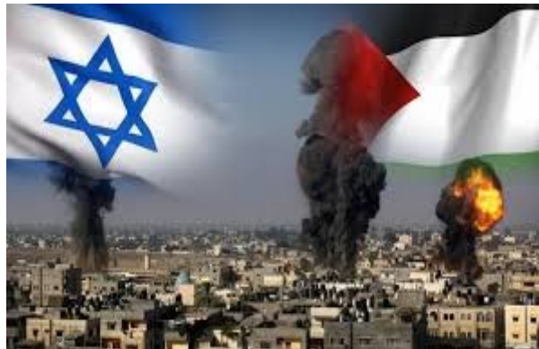
Gambar 5. Konflik Israel dan Palestina

https://www.liputan6.com . 15 September 2020, 09.00 WITA