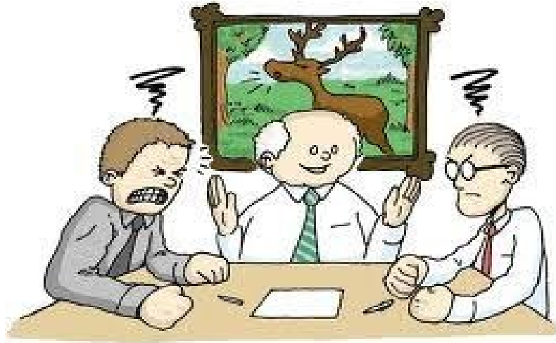
Gambar 21. Ilustrasi mediasi

http://lbhpengayoman.unpar.ac.id . 17 September 2020, 08.00 WITA