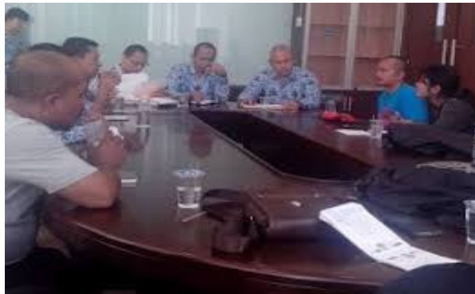
Gambar 22. Konsiliasi

https://solidaritas.net . 17 September 2020, 18.00 WITA