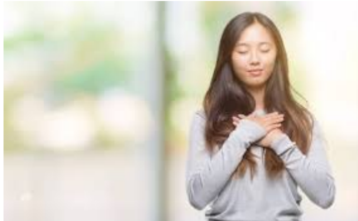
Gambar 20. Mengolah emosi

https://hellosehat.com . 16 September 2020, 18.00 WITA