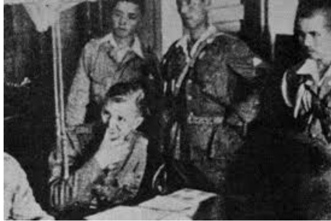
Gambar 10. Zaman kolonial

https://www.kompas.com . 15 September 2020, 11.00 WITA