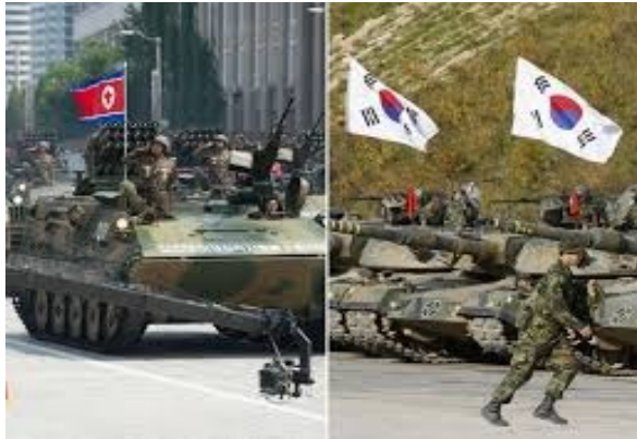
Gambar 6. Konflik Korea Utara dan Korea Selatan

http://berita.dreamers.id .15 September 2020, 10.00 WIB