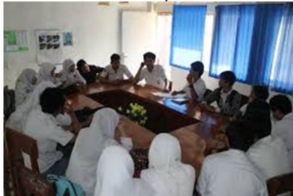
Gambar 7. Rapat OSIS

http://mejabelajaramel.blogspot.com .15 September 2020, 10.00 WITA