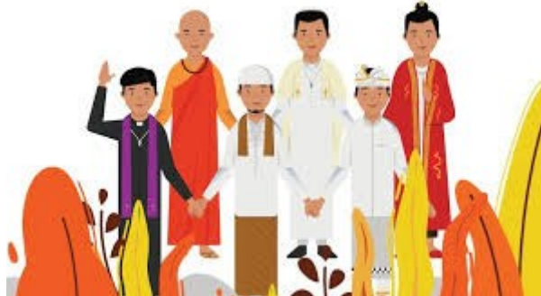
Gambar 19. Ilustrasi toleransi

http://www.dakta.com . 16 September 2020, 18.00 WITA