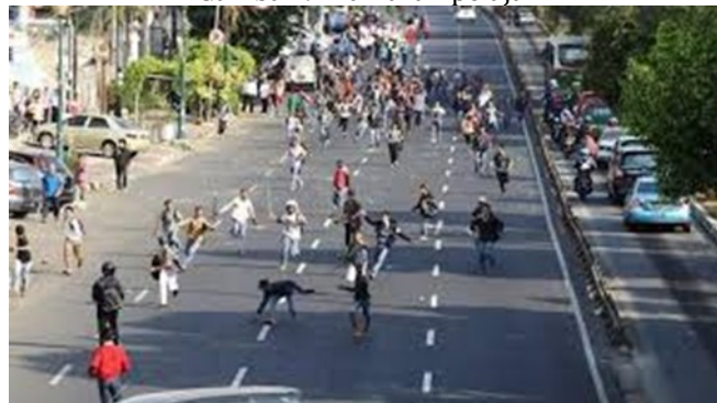
Gambar 9. Tawuran pelajar

https://jakarta.tribunnews.com . 15 September 2020, 10.00 WITA