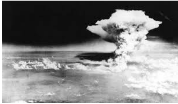
Gambar 25. Akibat perang dingin antara AS, Uni Soviet dan Cina

https://dunia.tempo.co . 17 September 2020, 19.00 WITA