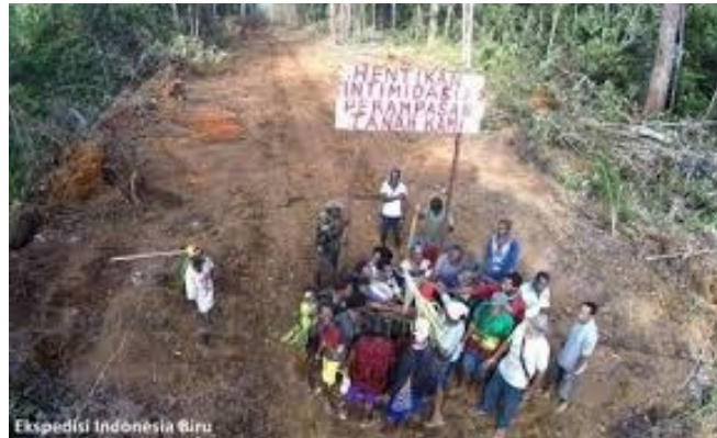
Gambar 13. Perebutan lahan

https://www.quareta.com . 17 September 2020, 10.00 WITA