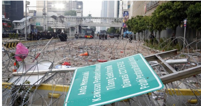
Gambar 15. Kerusakan sarana dan prasarana akibat konflik

https://tirto.id . 16 September 2020, 12.00 WITA