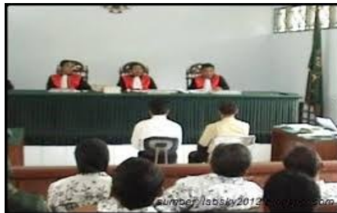
Gambar 24. Arbitrasi

https://sumberbelajar.belajar.kemdikbud.go.id . 17 September 2020, 19.00 WITA