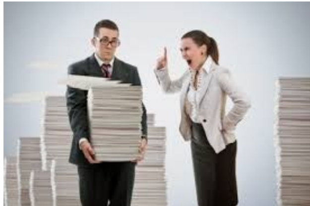
Gambar 4. Konflik vertikal

https://motivatorindonesia.net , 14 September 2020, 11.00 WITA