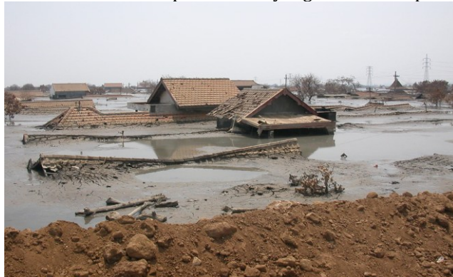
Gambar 17. Kondisi daerah pemukiman yang terkena lumpur Lapindo

https://id.wikipedia.org , 16 September 2020, 12.00 WITA