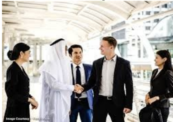
Gambar 23. Negosiasi

http://shiftindonesia.com . 16 September 2020, 18.00 WITA