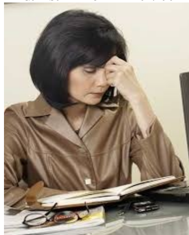
Gambar 2. Konflik Individu