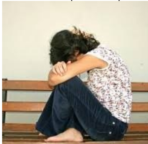
Gambar 14. Kondisi perubahan kepribadian

https://health.detik.com . 16 September 2020, 12.00 WITA