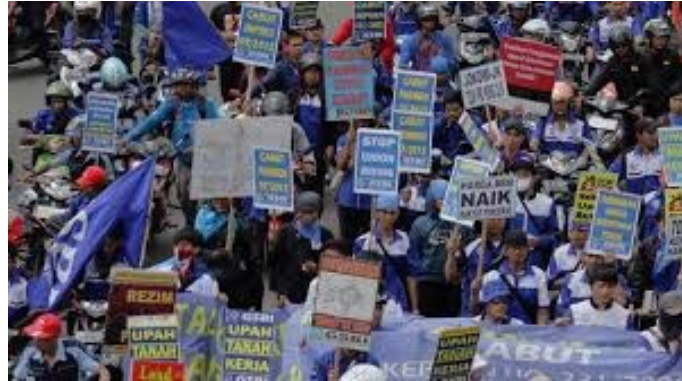
Gambar 8. Demonstrasi masa

https://www.liputan6.com . 15 September 2020, 11.00 WITA