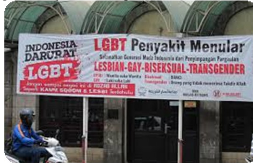
Gambar Peringatan bahaya LGBT sebagai masalah sosial karna faktor psikologis