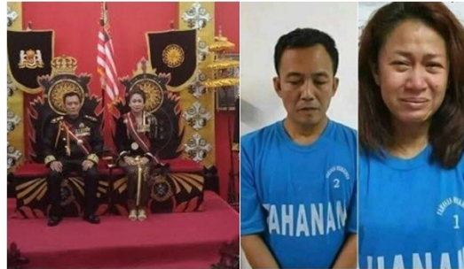
Gambar Raja dan Ratu Agung Sejagat dari Purworejo