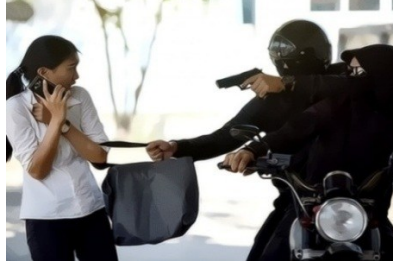
Gambar tindakan Perampokan dengan kekerasan.