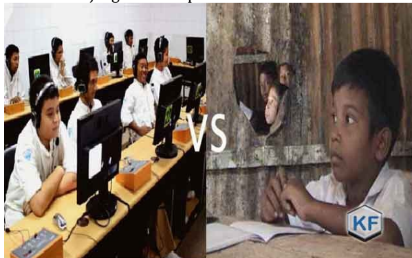
Gambar kesenjangan dalam pendidikan karena faktor ekonomi.