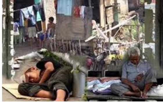
Eksklusi sosial orang miskin yang terpinggirkan oleh masyarakat