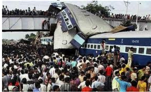
Gambar 8. kerumunan orang menonton kecelakaan Kereta