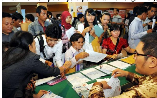
Gambar 10. Kumpulan para pendaftar lowongan kerja