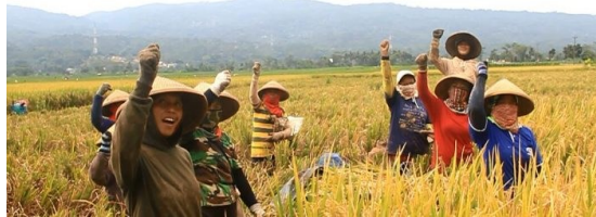
Gambar 3. Situasi panen oleh kelompok Petani

Sumber : https://lisa.id/petani/artikel/5d5a1fb1b1890a0e63b3ac0f