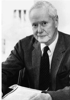
Gambar 2. Tokoh Sosiologi Rober K. Merton

Bisa jadi kita memang secara tidak sadar bergabung dengan sebuah kelompok. Namun selalu ada faktor di balik bergabungnya individu atau terbentuknya sebuah kelompok. Ada beberapa hal yang dapat membuat kita menciptakan atau bergabung dengan kelompok sosial.