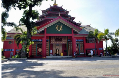
Gambar 12. Bentuk akulturasi budaya dan agama