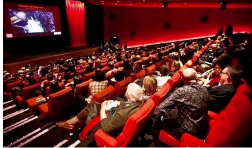
Gambar 5. penonton film di bioskop