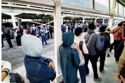
Gambar 6. antrian calon penumpang KRL hari pertama kerja