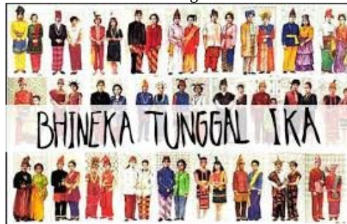
Gambar 13. Integrasi nasional