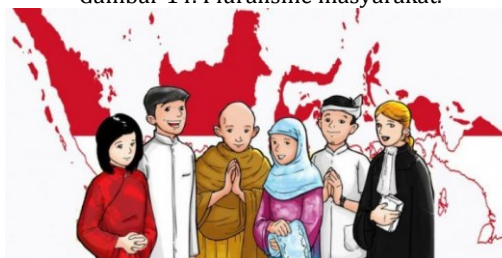
Gambar 14. Pluralisme masyarakat.