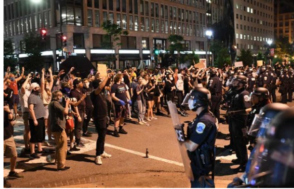
Gambar 9. Demonstrasi