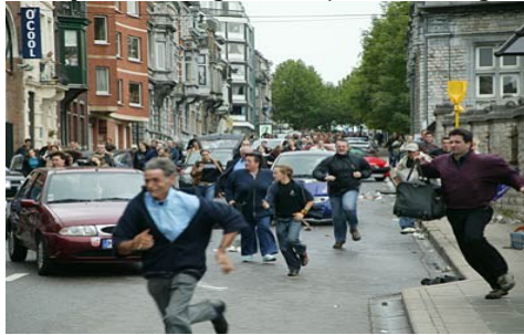
Gambar 7. kepanikan warga saat terjadi bencana gempa bumi