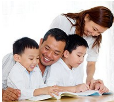
Gambar 1. Kasihsayang orangtua sebagai kebutuhan jasmani dan rohani anak

Sosiologi sebagai ilmu yang mempelajari tentang masyarakat tidak akan lepas dari individu dan aktivitas yang dilakukannya, Aristoteles mengemukakan bahwa manusia adalah makhluk sosial ( zoon Politicon ) yaitu bahwa manusia dikodratkan untuk hidup bermasyarakat dan berinteraksi satu sama lain. Sejak manusia dilahirkan di muka bumi pasti memerlukan bantuan dari orang lain, coba anda perhatikan, seorang bayi ketika lahir dari rahim seorang ibu tentunya mendapat bantuan dari bidan atau dukun bayi. Seorang bayi diberikan kasih sayang oleh orang tuanya dan keluarganya sehingga tumbuh dan berkembang di masyarakat. Hal itu mencerminkan bahwa setiap individu pasti memerlukan orang lain untuk mencukupi kebutuhan jasmani maupun rohaninya.