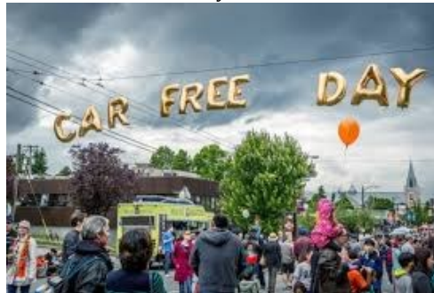
Gambar 4. Kerumunan masyarakat di acara Car Free Day