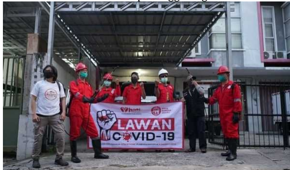
Gambar 11. Relawan penanganan covid-19