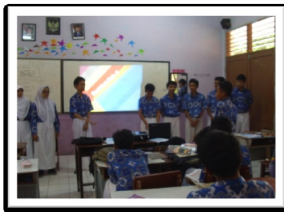
Gambar Ilustrasi Presentasi Laporan Penelitian

Hasil laporan penelitian yang telah ditulis, sebaiknya disajikan dalam bentuk presentasi kelas dengan cara diskusi. Hal ini penting untuk mempertanggung jawabkan laporan. Pemaparan dalam kelas dimaksudkan untuk memperoleh berbagai masukan.