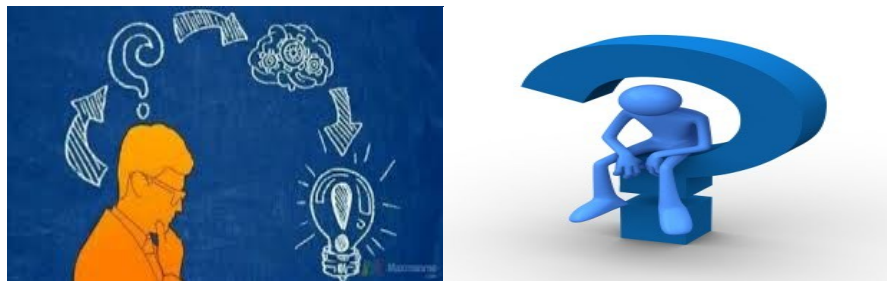
Gambar 1. Ilustrasi Penalaran www.kompasiana.com dan kemdikbud.go.id

Proses berfikir lahir dari rasa ragu terhadap suatu hal dan keinginan untuk memperoleh suatu kepastian sehingga kemudian tumbuh menjadi suatu masalah yang khas dan memerlukan pemecahan. Biasanya manusia selalu berfikir jika berhadapan dengan banyak permasalahan sehingga memunculkan keinginan berfikir untuk menyelesaikannya. Proses berfikir ini disebut dengan penalaran. Penalaran adalah suatu proses berfikir untuk memperoleh kesimpulan yang logis berdasarkan fakta yang relevan.