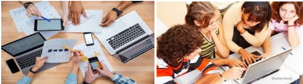
Gambar Ilustrasi Menyusun Laporan Penelitian (sumber:blog.ruangguru.com dan sosiologis.com)

Laporan penelitian adalah dokumen tertulis yang berfungsi sebagai media komunikasi antar peneliti dan pembaca. Syarat-syarat penulisan laporan: