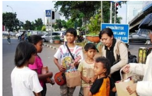
Gambar 2. Ilustrasi Penelitian ( www.sosiologis.com dan pustakabelajar.com )

Bentuk-bentuk pertanyaan seperti “ini apa?”, “itu apa?”, “mengapa hal ini bisa terjadi?”, “bagaimana memecahkannya?” dan lain-lain telah ada sepanjang sejarah manusia. Manusia berusaha mencari jawaban atas pertanyaan tersebut dan berusaha mendapatkan pengetahuan yang benar mengenai hal-hal yang dipertanyakan tadi. Salah satu cara untuk mendapatkan pengetahuan yang benar tersebut adalah melalui kegiatan penelitian. Kata penelitian adalah terjemahan dari kata bahasa Inggris research , yang berasal dari kata re (kembali) dan to search (mencari). Jadi research berarti mencari kembali suatu pengetahuan. Jadi, penelitian merupakan usaha untuk menemukan, mengembangkan dan menguji kebenaran suatu pengetahuan yang dilakukan dengan menggunakan metode ilmiah. Pengertian penelitian lainnya yaitu penelitian adalah suatu proses atau rangkaian langkah yang dilakukan secara terencana dan sistematis untuk mendapatkan pemecahan masalah atau jawaban terhadap pertanyaan-pertanyaan tertentu.