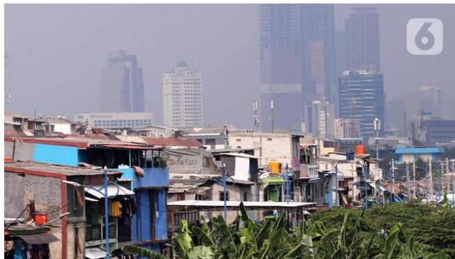
Permukiman padat penduduk dibantaran kali di Jakarta

Gara-gara corona, angka kemiskinan di Indonesia naik lagi menjadi 9,78 persen