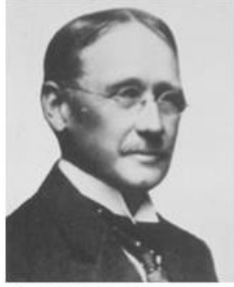
Frederick Winslow Taylor F. W. Taylor lahir pada 1856 di Inggris. Ia mengemukakan mengenai manajemen ilmiah dalam bukunya Principles of Scientific Management . Menurutinya, terbentuknya manajemen ilmiah bukan hanya ditentukan oleh suatu unsur saja, akan tetapi didukung oleh unsur-unsur lain yang saling berkaitan. Dengan adanya buku tersebut, Taylor dikenal sebagai Bapak Ilmu Manajemen. Sumber: Manajemen, 1999