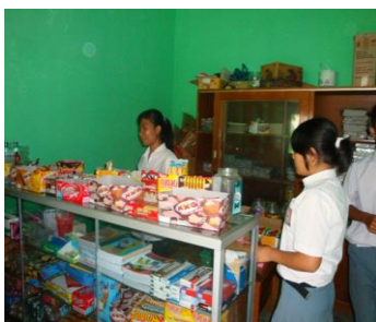
Gambar 2.1: Contoh Koperasi Sekolah

Koperasi sekolah adalah koperasi yang berada di lingkungan sekolah, baik sekolah dasar maupun sekolah menengah pertama dan sekolah menengah atas atau yang sederajat. Koperasi ini anggotanya seluruh siswa di sekolah tersebut. Koperasi sekolah sering kita kenal dengan nama koperasi siswa. Koperasi sekolah tidak berbadan hukum, koperasi ini dibentuk khusus untuk kepentingan pendidikan.