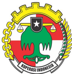
Gambar 1.2. Lambang Koperasi