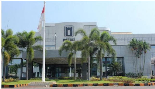
Perum Peruri (Pabrik Uang)