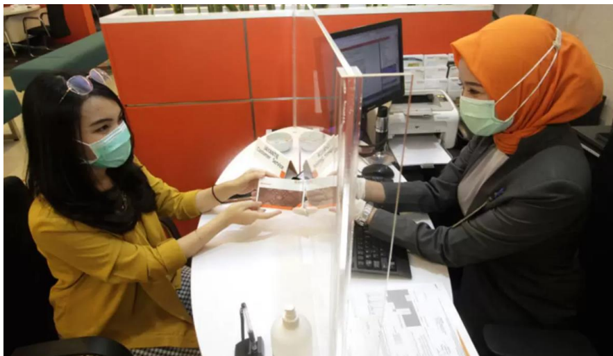
Gambar 1 Suasana Pelayanan Salah Satu Bank saat Pandemi Covid-19

Pada modul ini Anda akan diajak mempelajari lembaga keuangan yang terdiri dari bank dan nonbank. Bank sangat dekat dengan kehidupan kita sehari-hari. Dengan mempelajari bab ini, Anda akan memahami bagaimana lembaga keuangan berperan untuk membantu mempermudah kehidupan kita yang semakin modern ini.