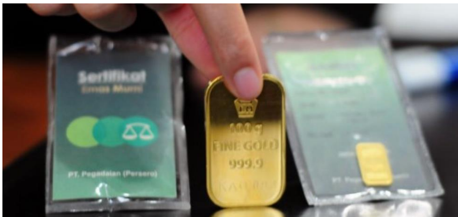
Gambar 4 “Nabung Emas” adalah Salah Satu Program Pegadaian