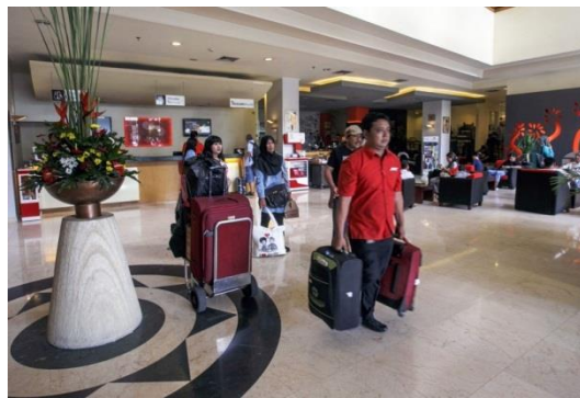
Gambar 1.1 Contoh perusahaan jasa

Perhatikan lingkungan sekitar anda, adakah perusahaan jasa? Salah satu contoh perusahaan jasa adalah hotel. Dalam melakukan kegiatan operasional, hotel akan mencatat segala transaksi ekonomi secara kronologis dan historis. Setiap transaksi yang berkaitan dengan perusahaan jasa dicatat sebagai bukti transaksi. Bukti transaksi inilah yang menjadi data pencatatan akuntansi bagi perusahaan. Selanjutnya, bukti transaksi dianalisis untuk mengetahui kondisi keuangan perusahaan dalam satu periode akuntansi.