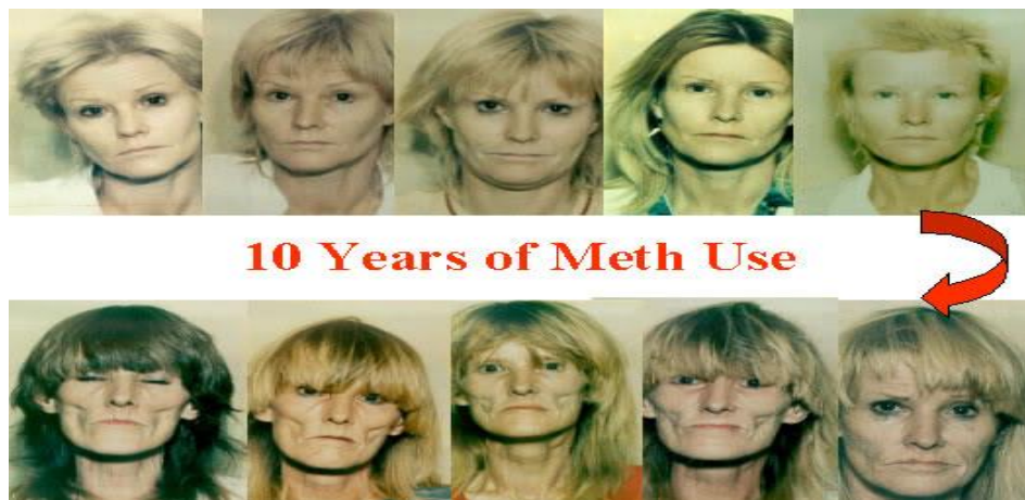
Gambar 1. Bahaya Penggunaan Narkoba

Amatilah gambar diatas? Dapatkah kalian memberikan ilustrasi mengenai gambar tersebut? Dapatkah kalian menjelaskan mengapa terjadi perubahan drastis pada wajah orang tersebut. Dapatkah kalian menganalisis penyebab dari perubahan tersebut? Salah satu penyebab hal tersebut adalah adanya penyalahgunaan dalam pemanfaatan psikotropika. Untuk menjawab pertanyaan tersebut pelajari modul berikut dengan saksama.