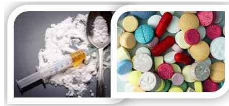
Gambar 2: Kokain dan ekstasi