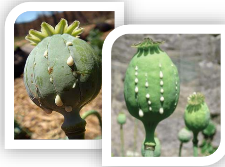
Gambar 3. Papaver somniferum (bahan pembuat opium)