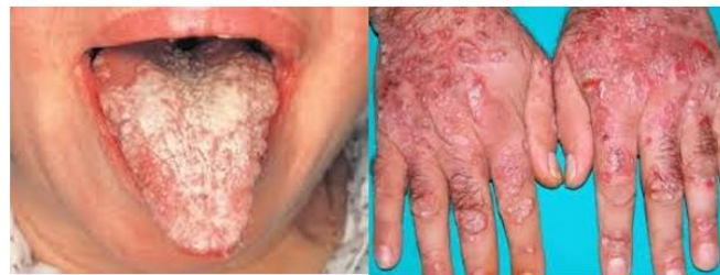
Gambar 4. Dampak Penyalahgunaan Narkoba

Amatilah gambar berikut. Taukah kalian bahwa penyalahgunaan narkoba dapat memberikan dampak yang sangat besar bagi kesehatan kita. Taukah kalian penyebab dari terjadinya penyakit seperti yang terdapat pada gambar dibawah ini. Untuk memahami dampak dari penyalahgunaan narkoba pahami dengan baik materi berikut.