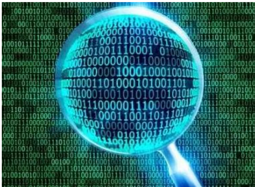
Gambar 5: Ilustrasi sebuah system digital, hanya ada kode 1 dan 0

Kata digital berasal dari kata Digitus (bahasa Yunani) yang berarti jari-jemari. Istilah digital menunjuk kepada jari-jari kaki dan tangan, yang telah dipakai selama ribuan tahun untuk menghitung dan menggambarkan data-data numerik. Teknologi digital sendiri merupakan sistem menghitung sangat cepat yang memproses semua bentuk