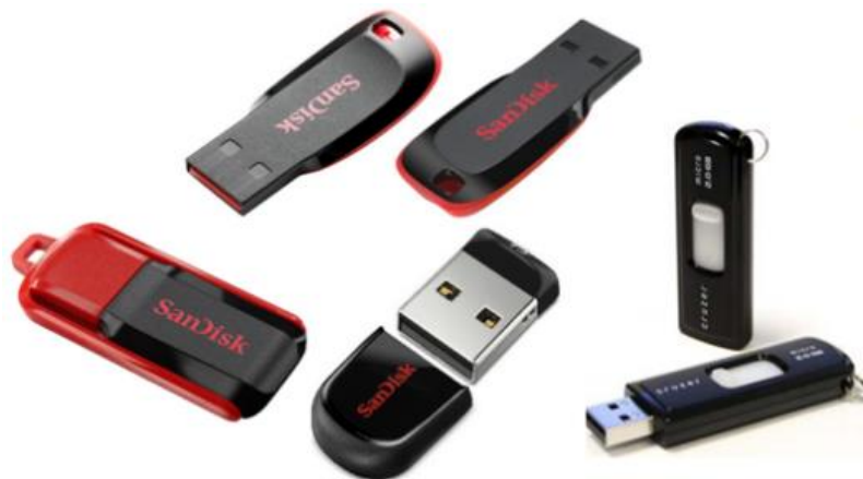
Gambar 7: Flas disk

Flashdisk adalah sebuah alat penyimpanan data eksternal yang dihubungkan port USB yang mampu menyimpan berbagai format data dan memiliki kapasitas penyimpanan yang cukup besar. Flashdisk dapat menyimpan data secara permanen walaupun aliran listrik pada rangkaian flashdisk diputuskan. Ini terjadi karena didalam flashdisk terdapat sebuah controller dan memori yang mampu menyimpan data secara permanen walaupun aliran listrik yang ada pada flashdisk sudah diputuskan oleh user.