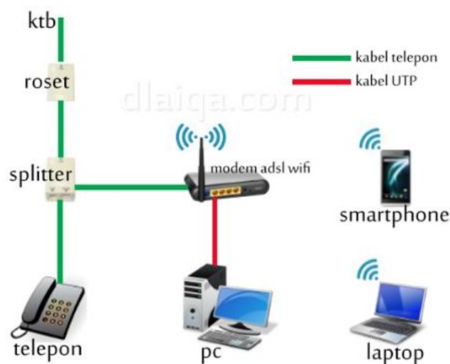
Gambar 10: Cara kerja panggilan dari telepon genggam ke telepon rumah

Ketika melakukan panggilan dari telepon genggam ke telepon rumah biasa, panggilan tersebut akan dihantarkan melalui antenna wireless terdekat dan akan diubah oleh penghantar wireless ke sistem telepon landline tradisional. Panggilan tersebut kemudian akan langsung diarahkan ke jaringan telepon tradisional dan ke orang yang menjadi tujuan panggilan. (Tim Penyusun, 2018: 184)