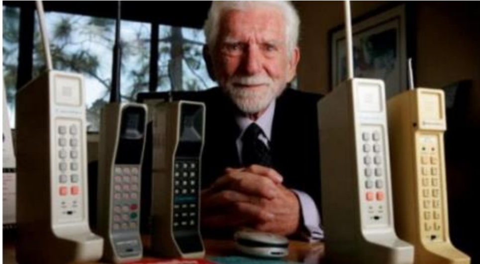
Gambar 9: Martin Cooper, penemu telepon seluler

untuk dipegang oleh tangan. ukuran yang besar ini dikarenakan keperluan tenaga dan performa baterai yang kurang baik. Selain itu generasi 1-G masih memiliki masalah dengan mobilitas pengguna. Pada saat melakukan panggilan, mobilitas pengguna terbatas pada jangkauan area telepon seluler. (Tim Penyusun, 2018: 183)