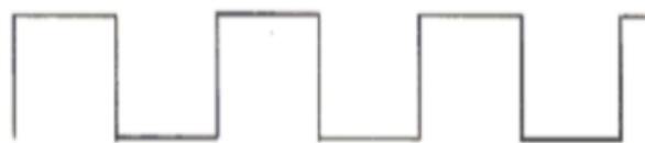
Gambar 13: Sinyal digital