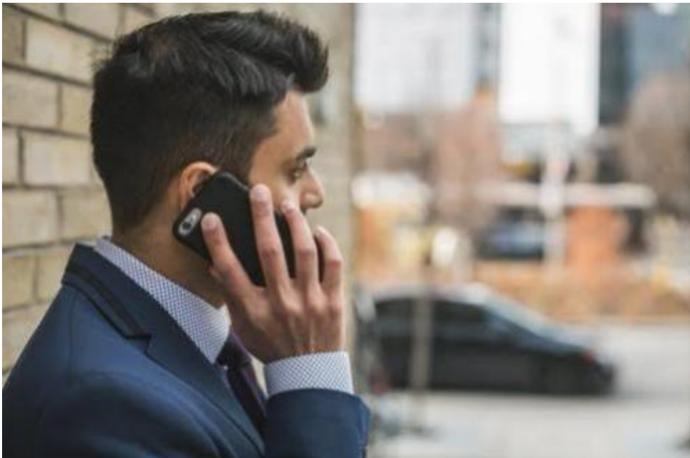
Gambar 4: Komunikasi menggunakan telepon