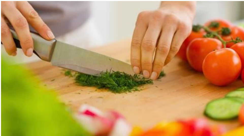
Gambar 2: Memotong sayuran dengan pisau