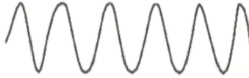
Gambar 12: Sinyal analog

Analog disebarluaskan melalui gelombang elektromagnetik (gelombang radio) secara terus menerus, yang banyak dipengaruhi oleh faktor "pengganggu". Analog merupakan bentuk komunikasi elektromagnetik yang merupakan proses pengiriman sinyal pada gelombang elektromagnetik dan bersifat variable yang berurutan. Jadi sistem analog merupakan suatu bentuk sistem komunikasi elektromagnetik yang menggabungkan proses pengiriman sinyalnya pada gelombang elektromagnetik.