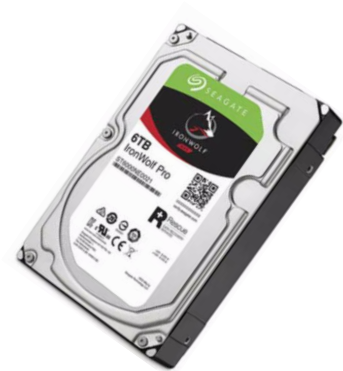
Gambar 6: Hard disk