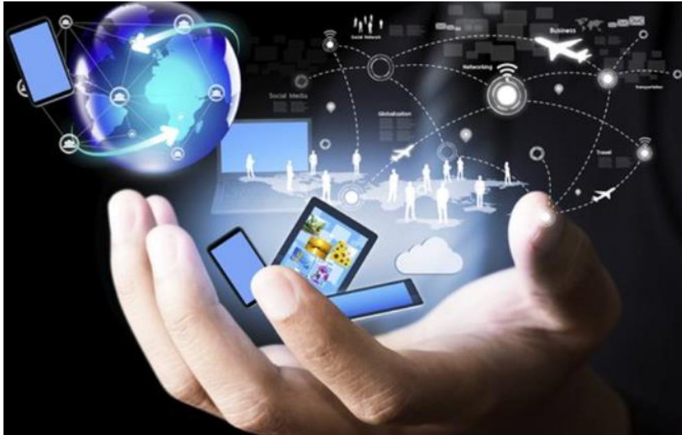
Gambar 6: Ilustrasi teknologi digital