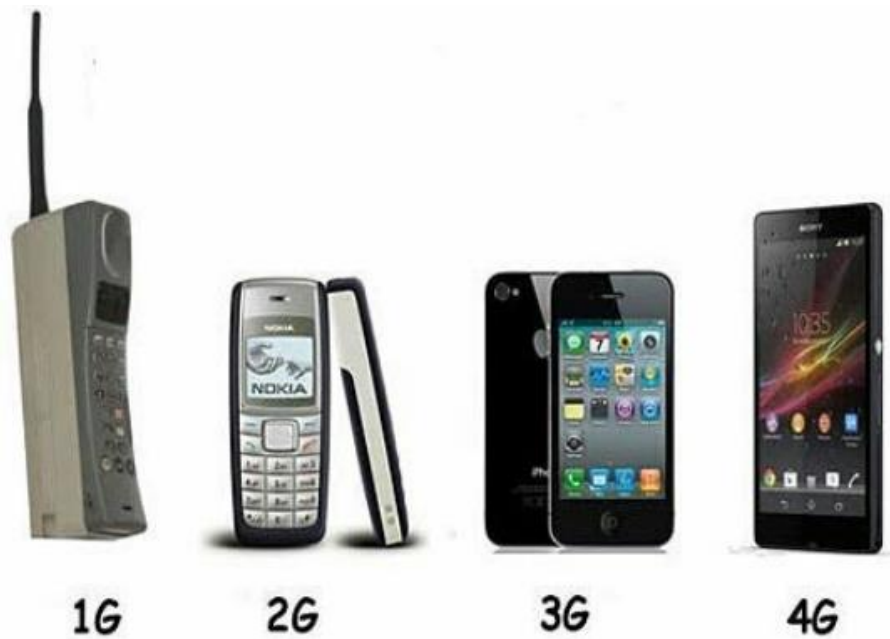
Gambar 9: Sejarah perkembangan telepon seluler

Bagaimanakah sejarah perkembangan telepon seluler? Simaklah penjelasan kemunculan ponsel dari generasi awal hingga terkini berikut ini!