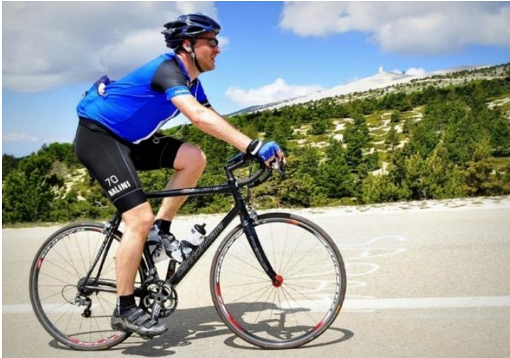
Gambar 3: Mengendarai sepeda