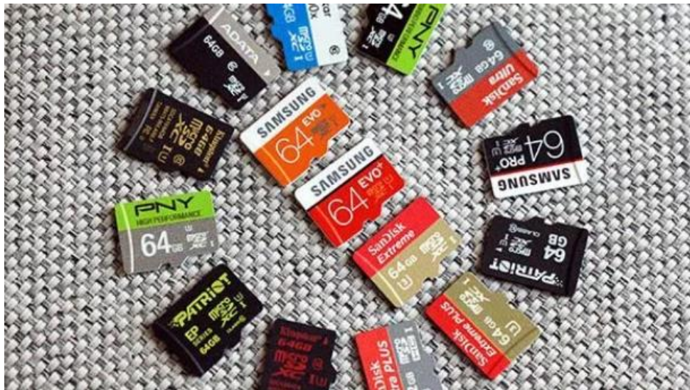
Gambar 8: MicroSD

MicroSD diaplikasikan pada berbagai peralatan teknologi, seringkali digunakan pada telepon genggam ( hand phone ).