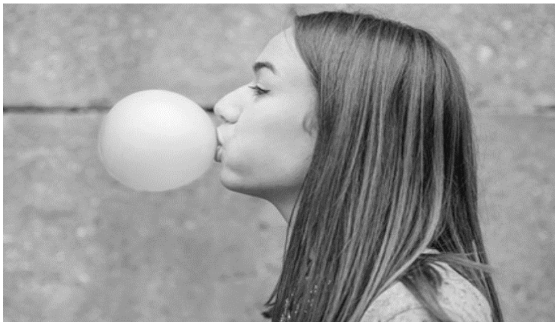
Kunyah permen karet dapat mengurangi gejala asam lambung naik