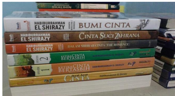
Berbagai judul teks drama