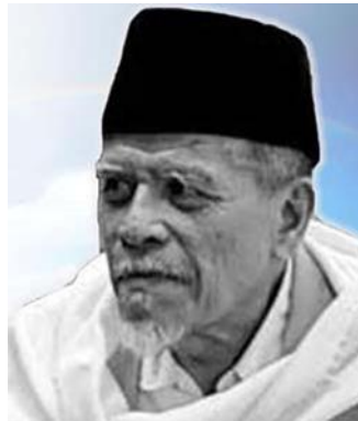
Buya Hamka ulama yang sekaligus sastrawan

Orientasi atau setting (aim), berisi pengenalan latar belakang kehidupan tokoh, yakni kisah ketika kecil atau keadaan keluarga.