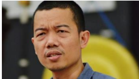
Tere Liye Muda Terkenal

Tere Liye merupakan nama pena seorang penulis tanah air yang produktif dan berbakat. Nama pena Tere Liye sendiri diambil dari bahasa India dan memiliki arti untukmu. Sebelum nama pena Tere Liye terkenal, ia menggunakan nama pena Darwis Darwis. Dan sampai sekarang, masyarakat umum bisa berkomunikasi dengan Tere Liye melalui facebook dengan nama „Darwis Tere Liye”. Banyak penulis biografi singkatnya yang menyimpulkan nama aslinya adalah Darwis.