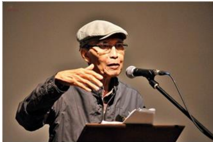
Sang penyair legendaris Sapardi Djoko Damono